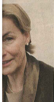
odbor za govora

opski diploma- rebu ne vjeruju čnost dovršetka atske s EU u lip- ers. "Mislim da avršiti pregovo- o ne i nemogu- rebalo još neko- mjeseći", rekao Inija je namije- 3,5 mlrd. eura za ne članstva, pod Zagreb priključi već sada nemo- fikacijskog pro- do dvije godine. ibili sredstva za e završimo pre- u, izgubit ćemo 013. godinu. Ta- i još nepoznat fi- za razdoblje na- kla je za Reuters predsjednica Na- pora za praćenje govora s EU pd